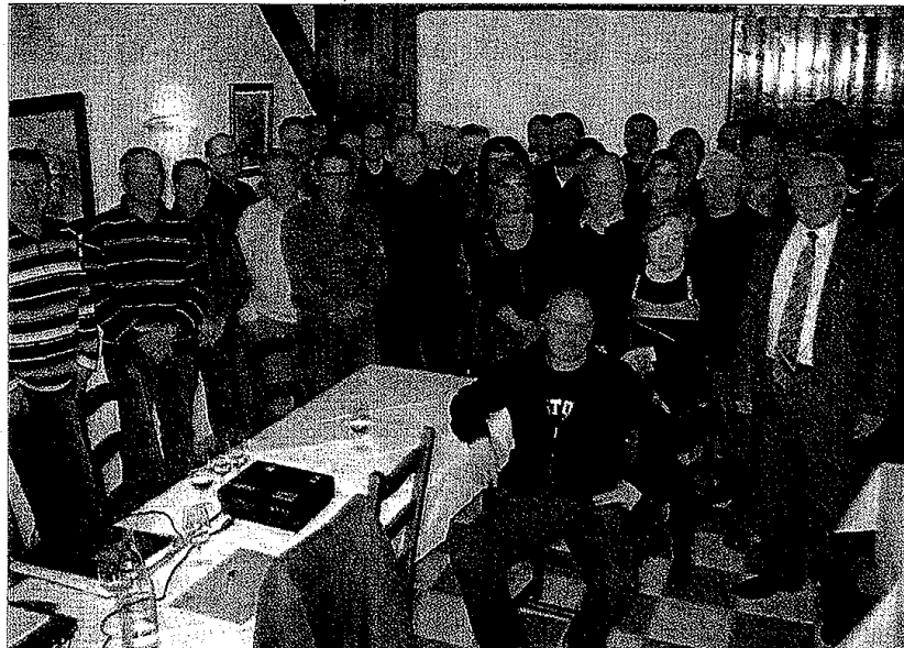
Les délégués sont conscients de leur mission jugée indispensable.

Des travaux ont en outre été exécutés pour un montant de 4 464 € entre Eblange et Bettange, à Freistroff, Diding et Bouzonville. Le syndicat a bé-